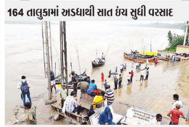
164 તાલુકામાં અડધાથી સાત ઇંચ સુધી વરસાદ

એલઈ કરાયા છે. ભરૂચના ગોહન જિજ ખાતે નર્મદા નદીની જળ સપાટી ૧૯.૦૫ ફૂટે પહોંચી કિનારા ના લોકોને એલઈ કરવામાં આવ્યા છે. કેવડિયા ખાતે સરદાર સરોવર નર્મદા ડેમની જળ સપાટી તા.૧૬ મી ઓગસ્ટ ને મંગળવારના રોજ પાંચ કલાકે ૧૩૪.૭૪ મીટરે નોંધાયેલ છે. નર્મદા ડેમના ૨૩ દરવાજા ૨.૯૦ મીટર સુધી ખોલીને સરેરાશ આશરે ૪.૫ લાખ ક્યુસેક પાણીનો જથ્થો નર્મદા નદીમાં છોડાઈ રહ્યો છે. તેની સાથોસાથ ભૂગર્ભ જળવિદ્યુત મથકમાંથી વિજ ઉત્પાદન બાદ છોડાઈ રહેલા આશરે ૪૫ હજાર ક્યુસેક પાણી સહિત કુલ ૪.૯૫ લાખ ક્યુસેક પાણીનો જથ્થો નર્મદા નદીમાં છોડાઈ રહ્યો છે.