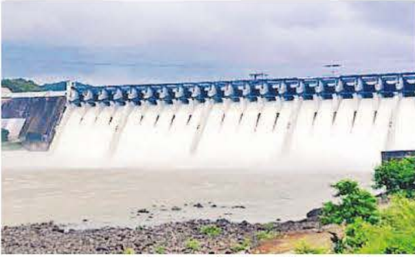
નવગુજરાત સમય &gt; રાજપીપળા

મધ્યપ્રદેશ અને નર્મદા ડેમના ઉપરવાસમાં સતત વરસાદ ચાલુ રહેતા સરદાર સરોવર નર્મદા ડેમમાં પાણીની આવક સતત ચાલુ રહી હતી. જેના પગલે મંગળવારે સાંજે પાંચ કલાક ડેમની જળ સપાટી ૧૩૪.૭૪ મીટરે પહોંચી હતી. ડેમમાં પાણીની આવક ૩.૪૩ લાખ ક્યુસેક રહી હતી. જ્યારે ડેમના ૨૩ દરવાજાઓ ૨.૯૦ મીટરે ખોલવામાં આવતાં તથા જળ વિદ્યુત મથકમાંથી વિજ ઉત્પાદન બાદ છોડાઈ રહેલા પાણી મળી કુલ ૪.૯૫ લાખ ક્યુસેક પાણીનો જથ્થો નદીમાં છોડવામાં આવી રહ્યો છે. જેને પગલે અંકલેશ્વર તાલુકાના ૧૩ ગામોને